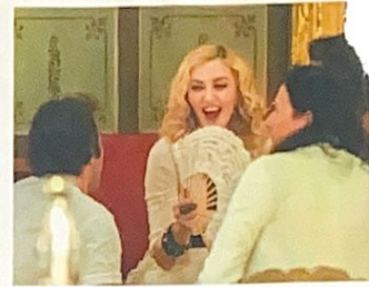
MADONNA EN 2016.

Visiter La Habana Vieja, c'est goûter à coup sûr au charme ineffable de ces cœurs de villes qui portent, sous la déchéance de leurs vieilles pierres, la noblesse d'une très riche histoire. Les façades en ruine valent autant que les splendides monuments rénovés. Un vrai quartier populaire, persillé d'îlots de luxe!